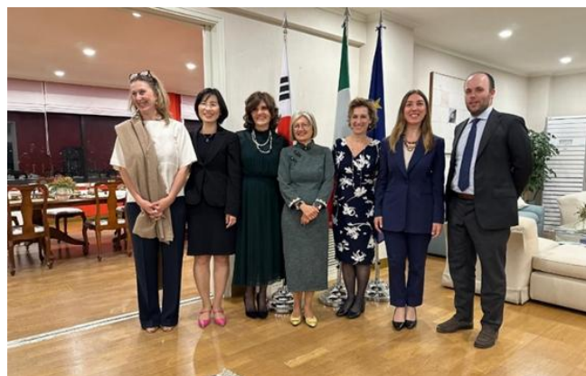
Nelle foto gli Ospiti dell'Ambasciatrice Gatto che nella foto successiva è solo con la Delegazione dell'Ordine degli Avvocati di Milano.