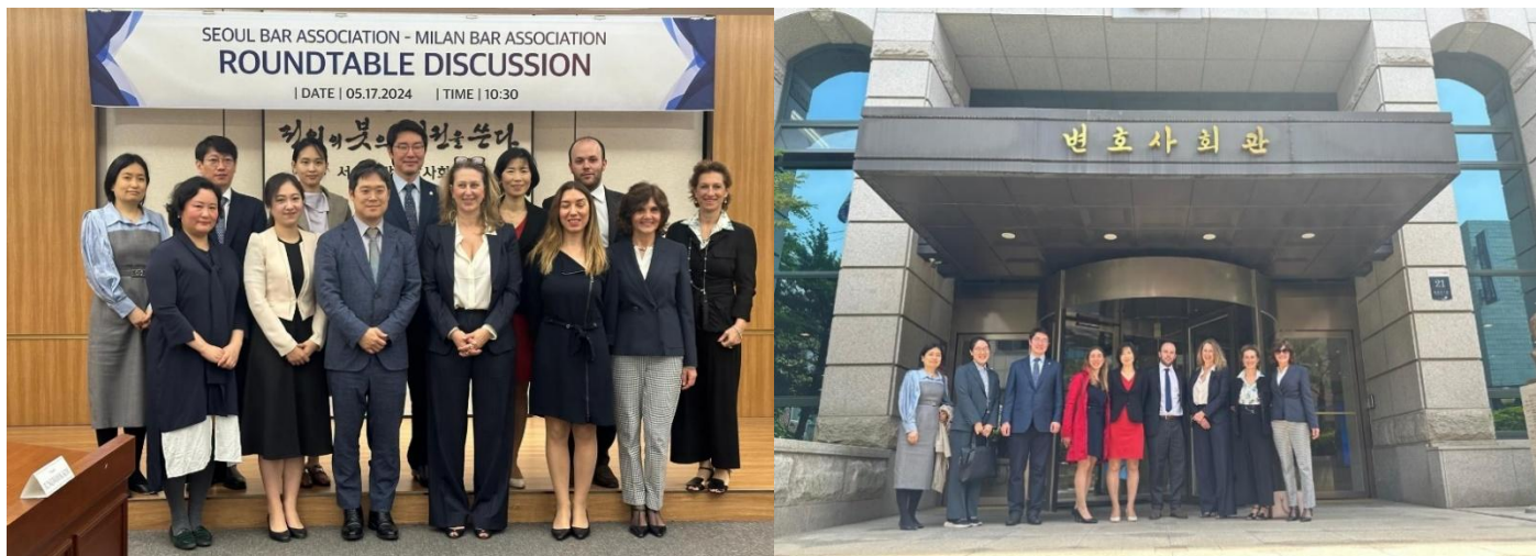
Nelle foto, presso la sede dell'Ordine degli Avvocati di Seoul, la Delegazione dell'Ordine degli Avvocati di Milano con i Rappresentanti dell'Ordine degli Avvocati di Seoul.

La Missione ha avuto un successo insperato, soprattutto grazie alla preziosa collaborazione dei Colleghi della Delegazione che mi hanno seguita in questa prima e molto impegnativa avventura.